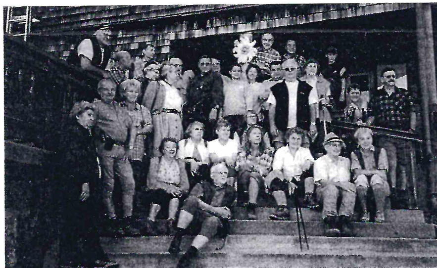
Gruppenbild vom Hüttentreffen von 25.08.00 bis 27.08.00

Allen Mitgliedern wünschen wir ein gesundes und erfolgreiches Bergsteigerjahr 2001