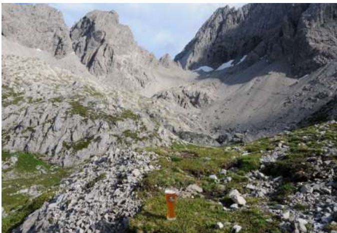
Ein Weizen wartet „einsam“ auf seinem Abnehmer