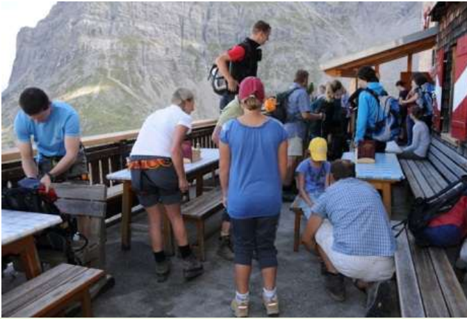
Die nächsten Kletterer/innen sind „startbereit“