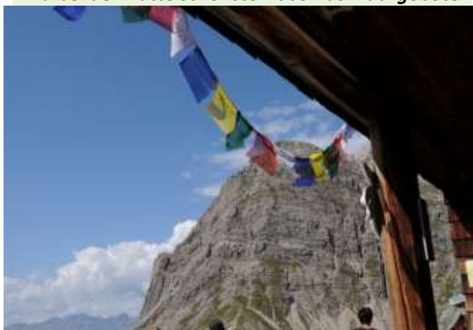
Nepal Feeling umgibt die Runde