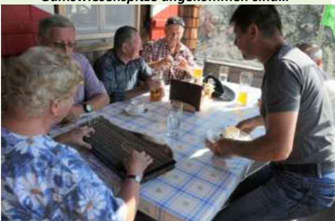
wird bei der Hütte schönste Hausmusik dargeboten