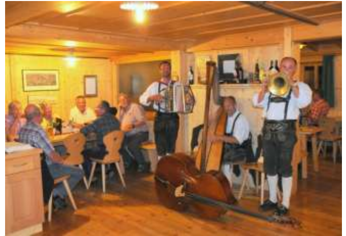
Die 3 Oberleibniger spielten stundenlang auf