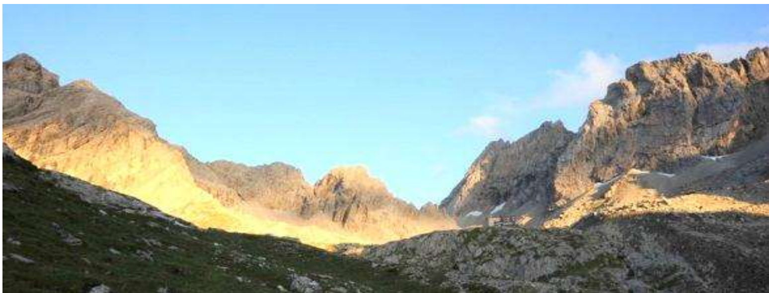
Panorama: Dieses Kaiserwetter war an den drei Tagen auf der KBH

Am nächsten Tag nach dem Abstieg stärkten wir uns in der Dolomitenhütte mit einem (gespendeten) Essen für die lange Heimreise. Womit auch ein schönes und uns allen noch lange in Erinnerung bleibendes Wochenende leider endete. Was für „coole“ Ferientage im Gebirge. Bericht der Ferienprogramm-Kinder vom 04.09.2011