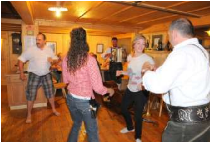
Und wie man sieht, es geht auch ohne Tanzschuhe