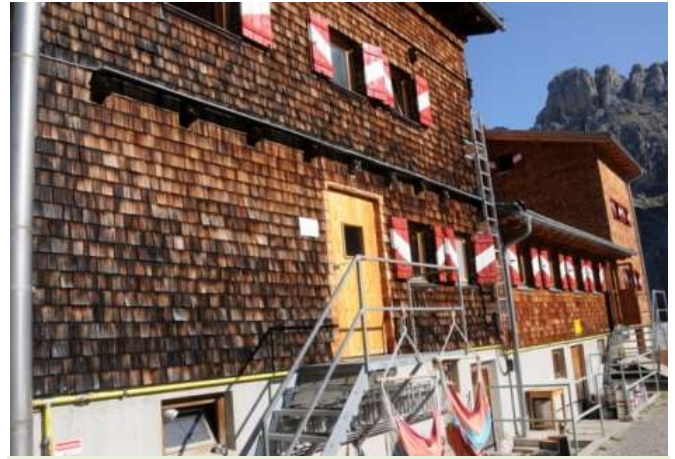
Bei diesem schönen Wetter in die Hängematte ??