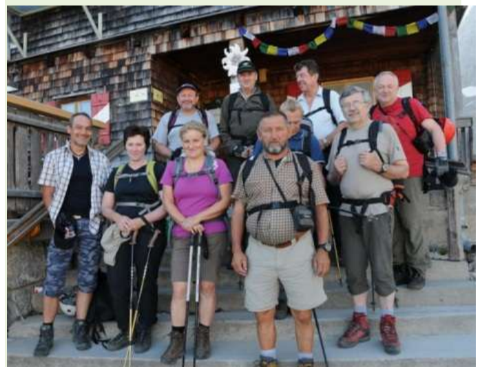
Die ersten Wanderer und Kletterer vor der Hütte