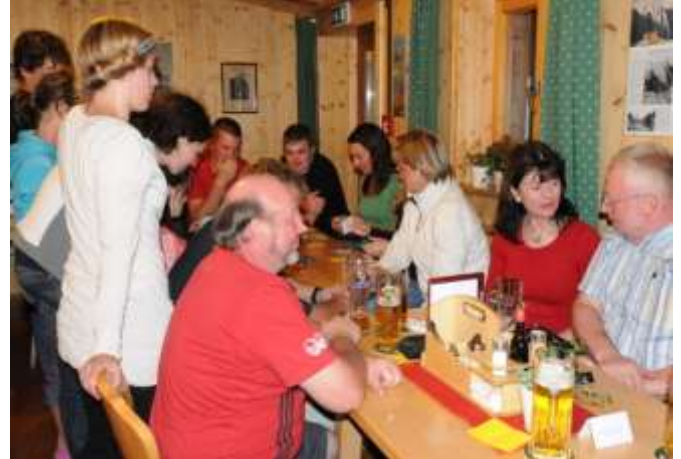
Dabei kam auch die Unterhaltung nicht zu kurz