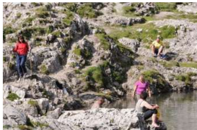
Der eiskalte Laserzsee ist nichts für „Weicheier“...