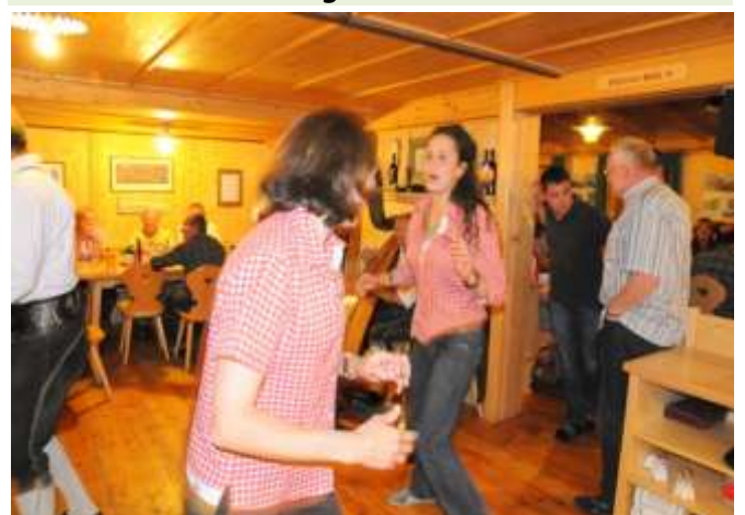
Ausgelassenes Tanzen: Mutter mit Tochter