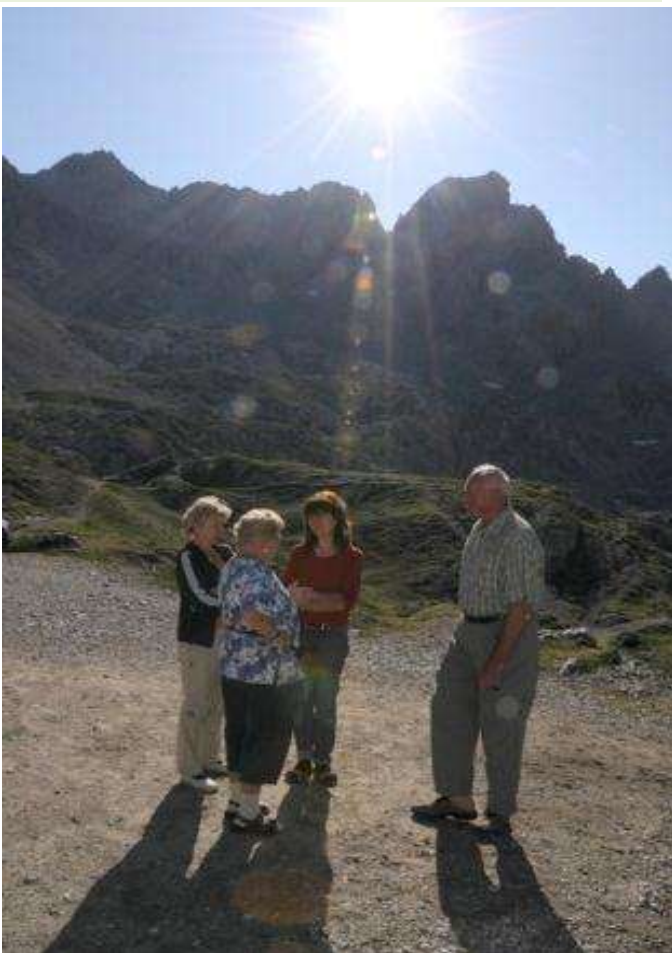
Und was unternehmen wir heute ? – Wandern ...