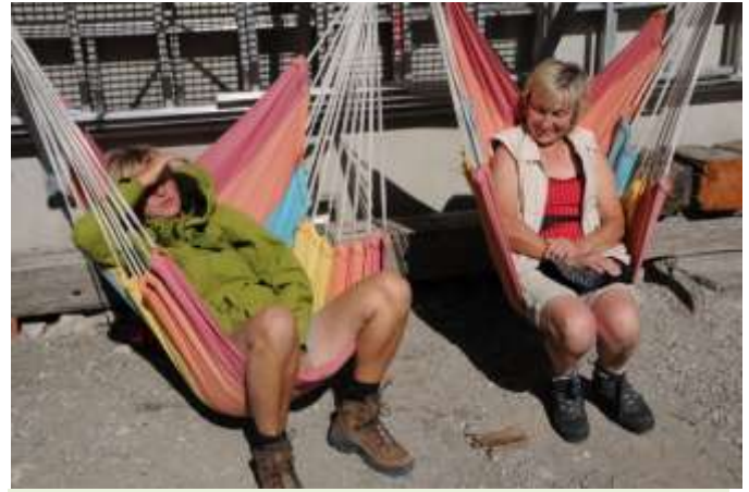
Am Morgen danach „Ausruhen“ in der Hängematte, das hatte aber mit dem Vortag nichts zu tun