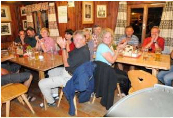
An allen Tischen herrschte eine gute Stimmung