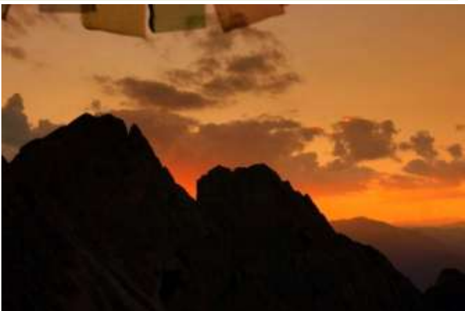
Wieder ein sehr stimmungsvoller Abend (Samstag)