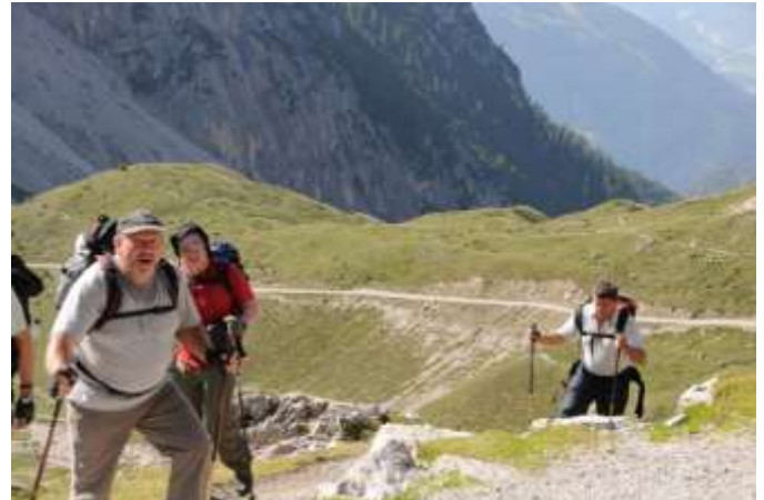
Die ersten müden Wanderer kommen zurück