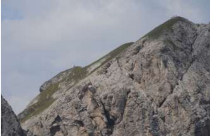
Während einige Kletterer auf der Gamswiesenspitze angekommen sind...