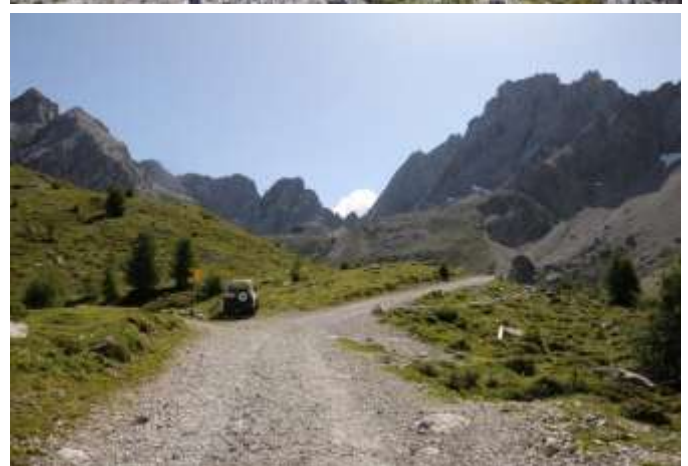
Blick vom Marcherstein aus – letztes Bild mit KBH