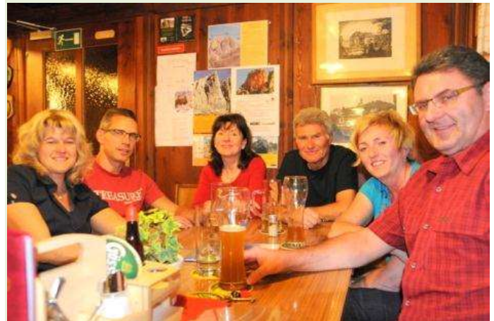
Am ersten Hüttenabend