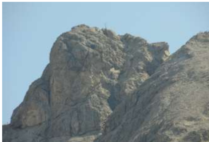
Gezoomt: Die Große Sandspitze