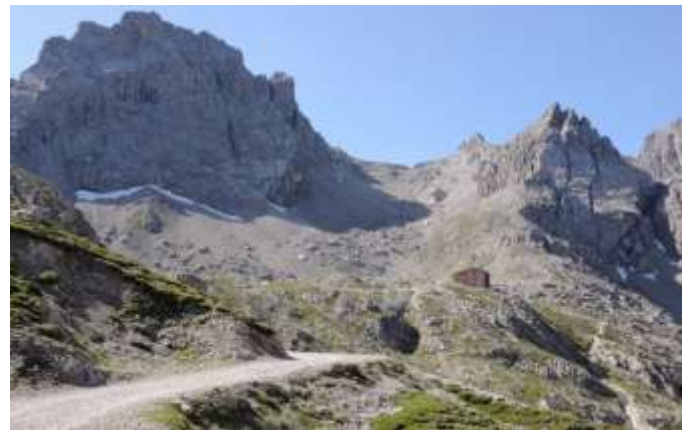
Bei diesem Anblick fällt einem es schwer, wieder Abschied von der Karlsbader Hütte zu nehmen