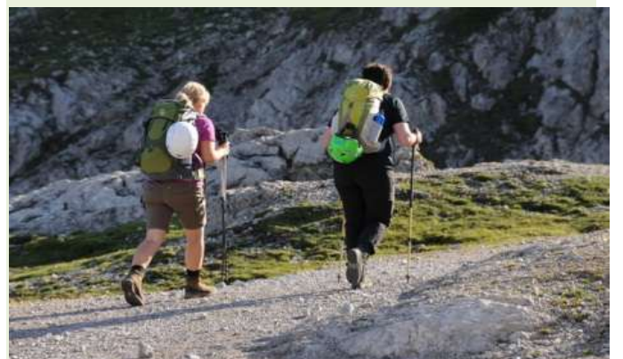
Im „Gleichschritt“ zum Panorama-Klettersteig