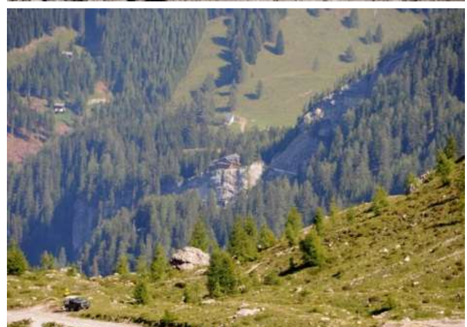
Blick auf die Lienzer Dolomitenhütte – alle drei Aufnahmen vom gleichen Standort aus