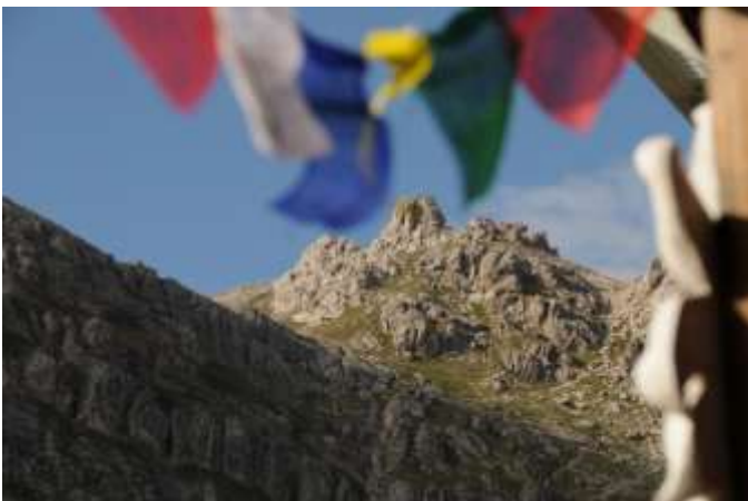
Diese Ausblicke laden zum Fotografieren ein