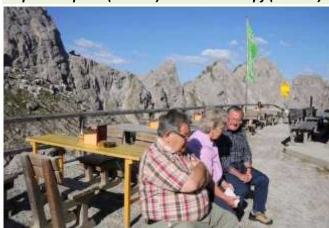
Aber auch so kann man die Zeit verbringen