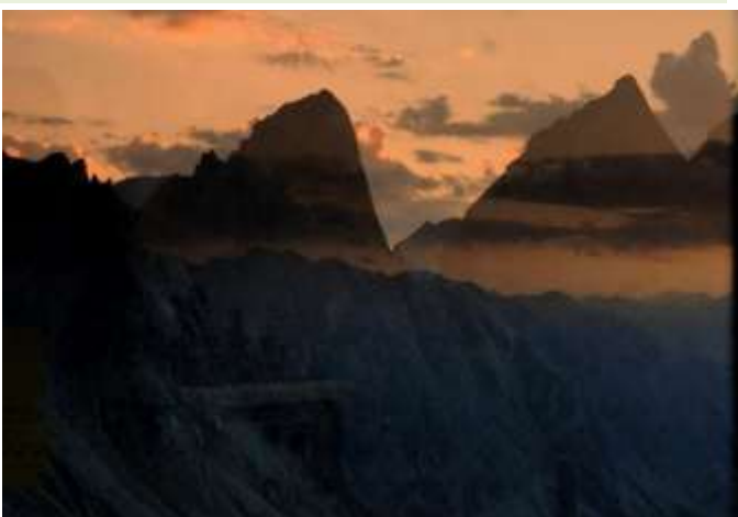
Sonnenuntergang mit Fensterspiegelung