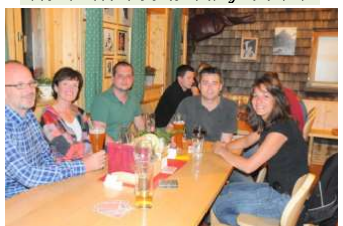
Auch der Schulungsraum war voll besetzt