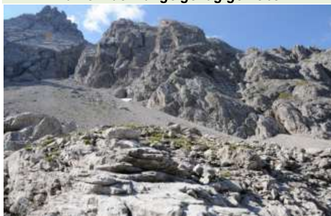
Teplitzer Spitze (2613m) und Simonskopf (2687m)