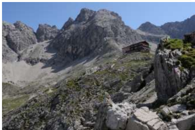
Karlsbader Hütte mit Sandspitze (2770m)