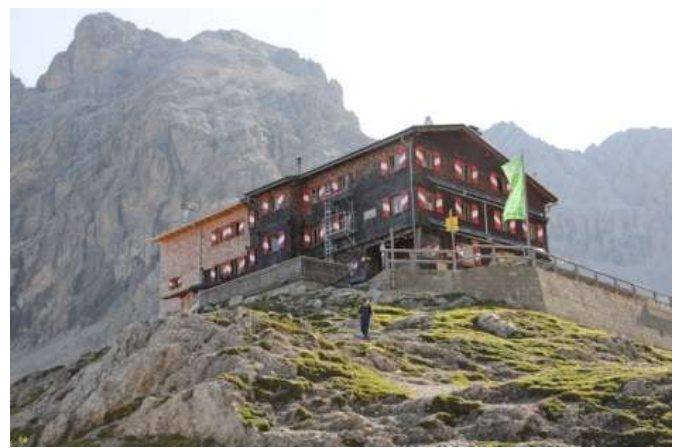
Nein danke – weitere Wanderer sind unterwegs