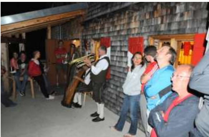
Alle lauschten fast andächtig der tollen Musik