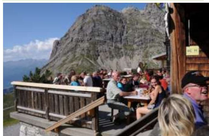
Die Sonnenterrasse „füllt“ sich immer mehr