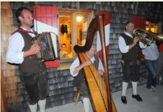
Uhrzeit 00.15 Uhr – „Mer soag i ned“