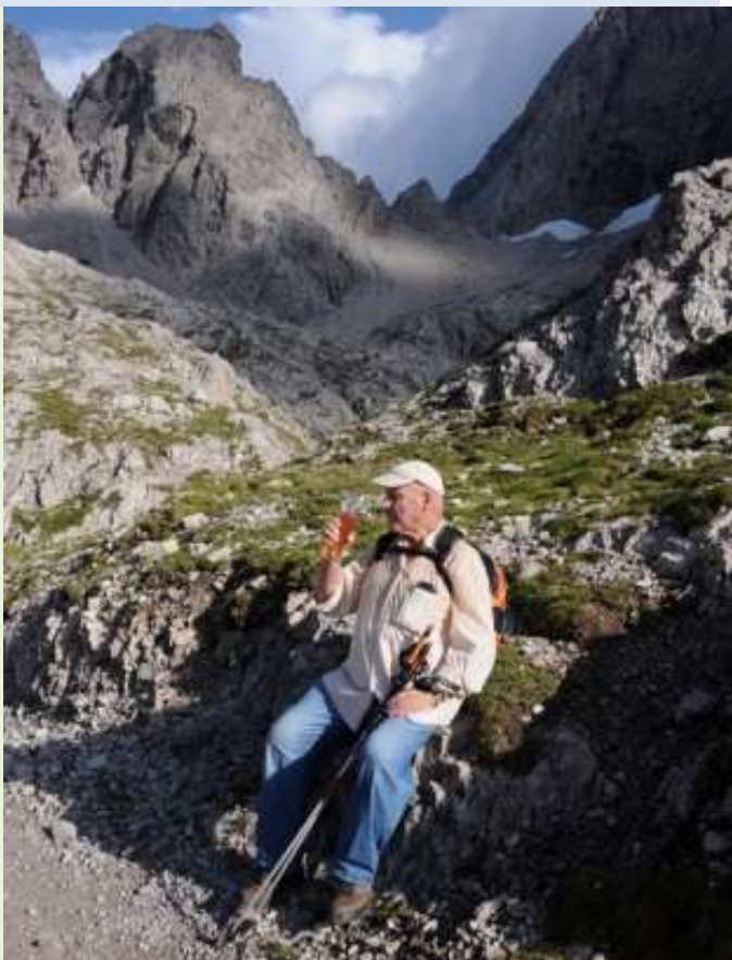
Das schmeckt aber – was für eine Wohltat