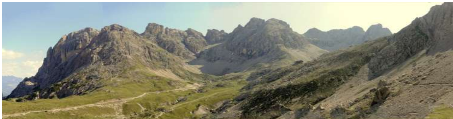
Panorama Richtung Nord-Osten: Der Laserkessel mit Karlsbader Hütte