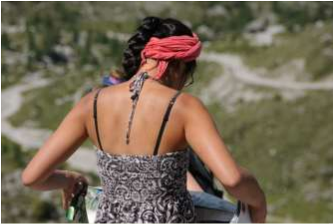
Ein schöner Rücken...– studiert die Wanderkarte