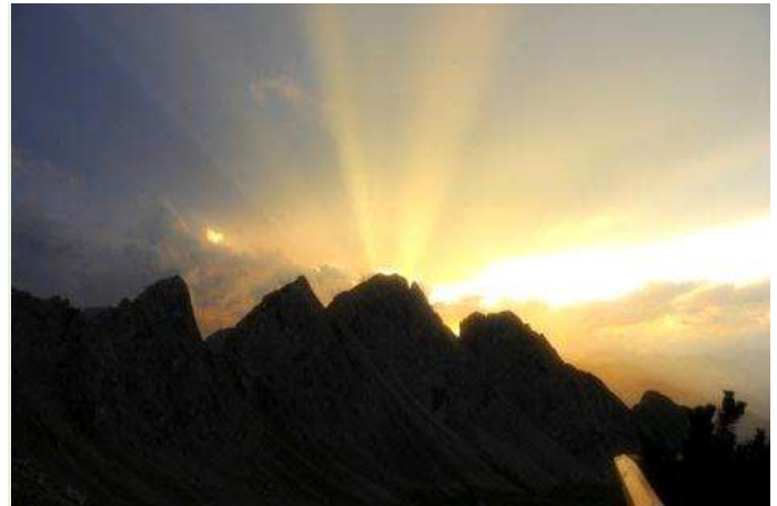
Stimmungsvoller Sonnenuntergang von Terrasse aus