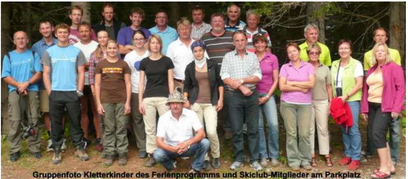
Gruppenfoto Kletterkinder des Ferienprogramms und Skiclub-Mitglieder am Parkplatz

Am Sonntag-Vormittag zurück zum Busparkplatz an der Lienzer Dolomitenhütte. Einige wählten den normalen Fahrweg andere sogar den Rudl Eller Steig als Abstiegsvariante. Nach einem Einkehrschwung in der Dolomitenhütte Rückfahrt um 15 Uhr nach Tirschenreuth. Gegen 22.30 Uhr kam die gemischte Gruppe wieder wohlbehalten an. Man war stolz auf ein wunderschön verbrachtes Herbst-Wochenende auf der Karlsbader Hütte.