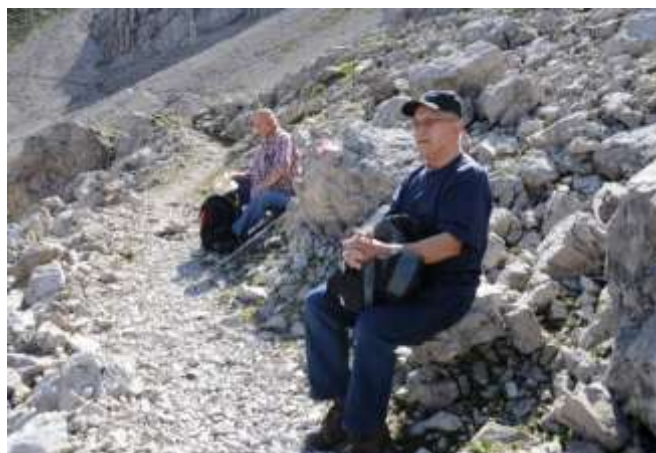
Eine „kleine“ Pause – diese Aussicht muss man einfach lange genug genießen