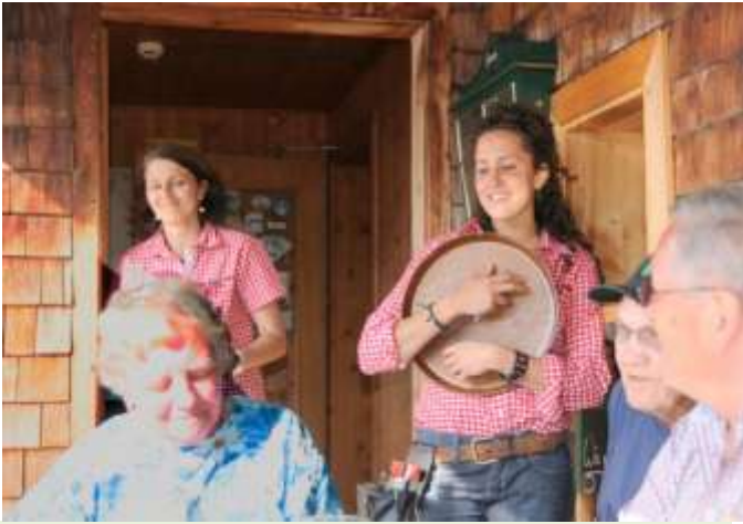
Man wird immer sehr freundlich bedient