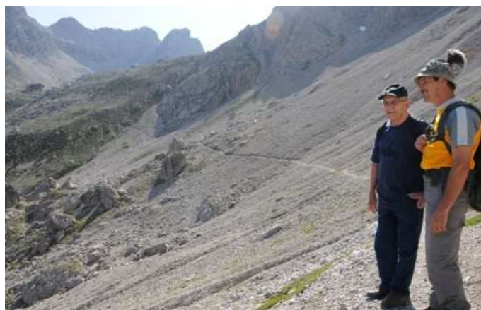
Busfahrer mit dem „Jüngsten“ – Sektionsmitglied