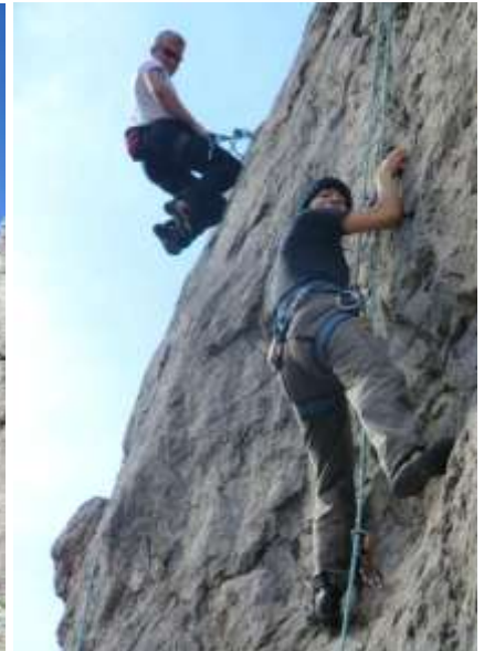
Unsere Gruppe vor der Hütte Beim „Lernen“ am Kletterfelsen Hier wird ohne Gefahr geübt

ins Bett: Hoffend, dass das Wetter morgen wieder schön sein würde. Wir wurden nicht enttäuscht. Schon nach dem ausgewogenen Frühstück konnten wir den wolkenlosen